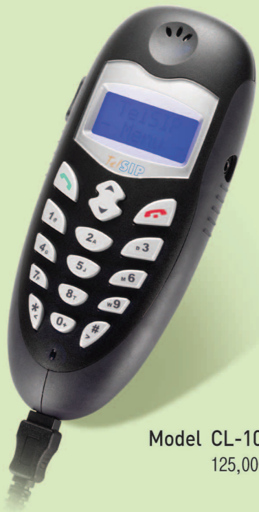
Model CL-1005 125,000원